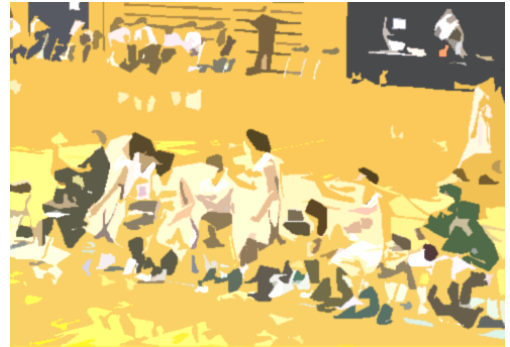
【ゴールを決め喜ぶ選手】

紫陽花を眺めながら、生徒が紫陽花のように美しく輝けるよう、さらに環境を整えたいと感じました。家庭・地域も生徒を美しい色に染め、成長させていく重要な土壌となります。共に良い土壌を作っていただければと願っています。ご協力をよろしくお願い致します。