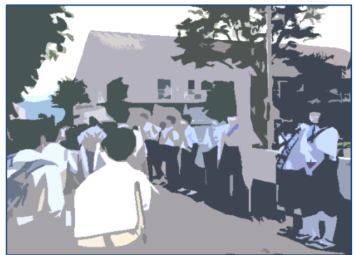
【秋の ALL 妙高あいさつ運動】