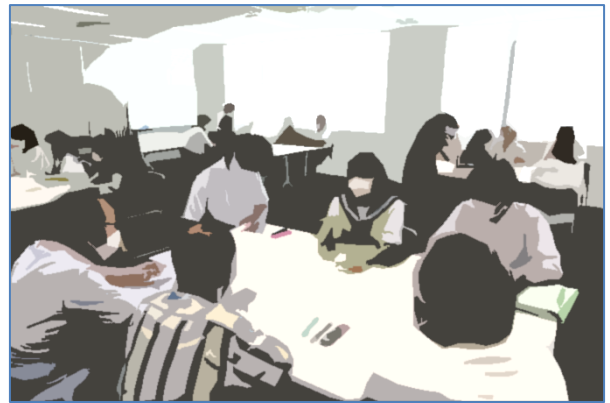
【堂々と意見を述べる生徒】

会議には、民生委員さん、町内会長さん（令和3年度後援会評議員）、父母と教師の会役員さん、教職員、生徒、学校運営協議会委員さん（総勢64名）が集まり、グループ協議を行いました。協議題を受けて、Keep（地域と中学生のつながりを感じる点）、Problem（つながりを活性化させる上での課題）を付せん書き出し、「つながりを活性化させる上で、挑戦できそうなこと（Try）」を話し合いました。Tryとして出された意見を右に紹介します。