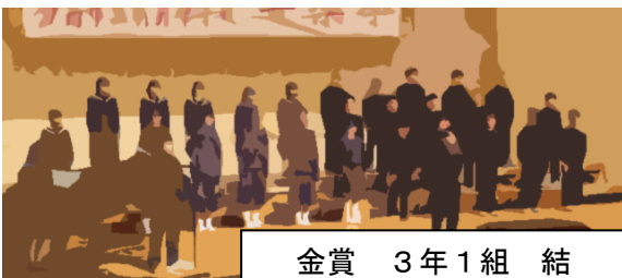
金賞 3年1組 結

○最初の練習では、伴奏が止まることもあり、本番までに仕上がるか不安でした。しかし、本番ではクラスの皆や指揮者と心をついに、納得のできる演奏ができ、嬉しさと達成感を感じることができました。