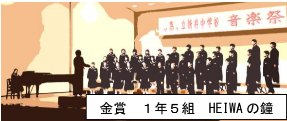
金賞 1年5組 HEIWAの鐘

10月29日（金）に妙高市文化ホールにて実施しました。1家族1名の入場制限、検温、座席の消毒等、新型コロナウイルス感染防止対策に御協力いただき、大変ありがとうございました。当日の発表を迎えるまでには、各学級で様々なドラマがありました。声量、バランス、思い、緊張…。こうした課題と向き合って、みんなで紡ぎ上げた合唱だったからこそ、聴衆の心を揺さぶり、感動を分かち合うことができたのだと思います。多くの皆さんから「素晴らしい。感動した」との賞賛の声をいただきました。審査員の先生方も、「校長先生、必ず賞を付けなければいけませんか？」と悩まれたそうです。どの学級も本当に素晴らしい合唱でした。金賞受賞クラスのリーダーの皆さんの感想を紹介します。