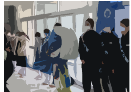
【生徒会あいさつ運動の様子】