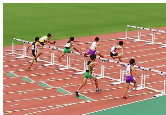
【北信越大会の様子】

に出場した4名の全力を尽くした活躍、中部日本大会で大健闘を見せた野球部、きれいで調和のとれた演奏で西関東大会出場を勝ち取った吹奏楽部、美しいハーモニーを会場に響かせた合唱部、私の主