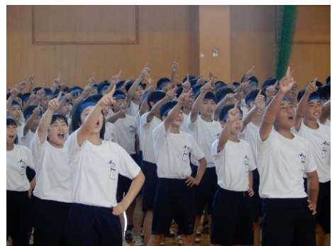
【体育祭練習の様子】

さて、いよいよ2学期が始まります。2学期は、体育祭、音楽祭、新人大会、駅伝大会、生徒会役員選挙、2年生は職場体験など大きな学校行事が控えています。2学期は、これらの行事や日常生活を通して、自分の内面を高め、自分を充実させる学期となります。そのために、ただ時間に流されるのではなく、いろんなことに 果敢に挑戦 してほしいと思います。若い年代は失敗することが許される時期です。それが皆さん若者の特権です。分からないことがたくさんあり、迷い悩むことも、皆さんの魅力でもあります。結果がどうあれ挑戦する行為こそが美しく尊いことです。その経験が皆さんを確実に成長させていきます。しかし、挑戦しなければ成功も失敗もありません。 果敢に挑戦 することで、自分をさらに大きく成長させる2学期にしてほしいと願っています。