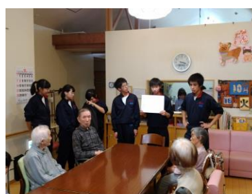
お年寄りと楽しく交流