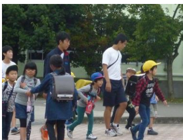
小学校の下校指導

今年度の地域貢献活動は、「社会に貢献をする体験」を、福祉、観光PR、小学校、清掃、樹木カード、花の苗・プランター設置という6つの内容で班ごとに取り組みました。市内の福祉施設や小学校、公共施設の皆様から御協力いただき、それぞれの場所で貴重な経験をさせていただき、本当にありがたく思います。それらを通して中学生が地域に貢献できることは何かについて考えを深めることができました。ありがとうございました。