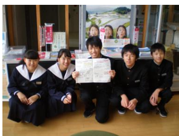
パンフレット作成と配布