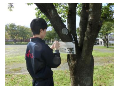
樹木カードの取付