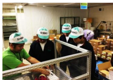
新光電気工業株式会社 新井工場