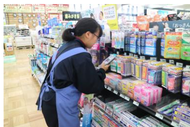
ホームセンタームサシ 新井店

3日間で実施しましたが、地域、保護者の皆様に御理解、御協力いただきましたことに深く感謝いたします。ありがとうございました。