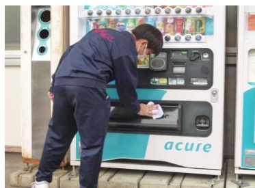
自販機の清掃(新井駅)

今年度の地域貢献活動は、「お世話になった人や場所に恩返し」をテーマに、妙高市内公共施設周辺の清掃活動、学校周辺のバス停路線図案内、小学校文化祭のお手伝い、新井駅の構内清掃、地域内の公園清掃、学校前道路の清掃といった内容で班ごとに取り組みました。市内の小学校、公共施設、町内会長の皆様から御協力いただき、それぞれの場所で貴重な経験をさせていただき、本当にありがたく思います。これを通して中学生が地域に貢献できることは何かについて考えを深めることができました。ありがとうございました。