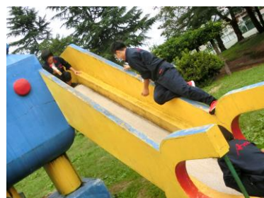
遊具の清掃(ロボット公園)