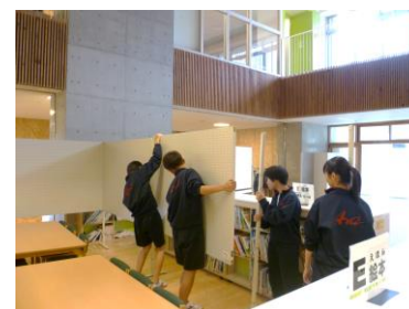
文化祭のお手伝い(新井小)