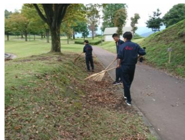
落ち葉拾い(総合運動公園)