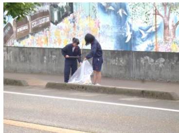
ゴミ拾い(学校周辺)