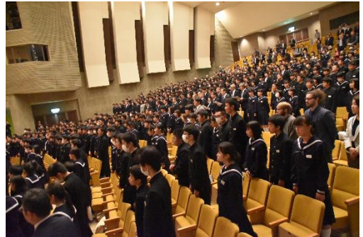
【記念式典：全員での校歌斉唱】

新井中学校の卒業生は一万人を超え、地元のみならず日本や世界を舞台に活躍されています。生徒数は、最盛期には一千二百二十三名でしたが、現在五百三十九名となり半数に減少しました。生徒数は減ってしまいましたが、現在、生徒は先人の伝統を引き継ぎ、新井中生であることへのプライドをもち「新井中ブランド」の実現に向け取り組んでいます。