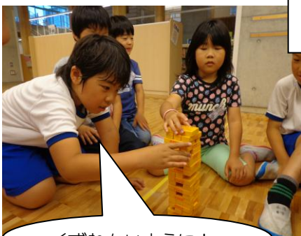
くずれないように！

翌日の昼休みは、ふれあい遊びを楽しみました。「だるまさんがころんだ」や風船バレー、大縄とびや椅子取りゲームなど、班ごとに遊びを決めてみんなで仲良く遊びました。高学年は、1年生に声をかけたり遊び方を教えたりするなど、リーダーとして頑張りました。今後は、月に1回ふれあい遊びを行う予定です。異学年交流を通して、互いの立場を思いやり、人と関わる力が身に付くよう、支援していききたいと思います。