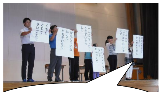
口をとじて、相手に顔を向けてうなずきながら聞こう！

話をしっかりと聞くことは、相手を大事にすることにつながります。新井中学校区では「話の聞き方」に重点を置いて各学校で共通に取り組んでいます。『口をとじて最後まで』『話している人に顔を向けて』『返事をしたりうなずいたりして』を目標によい例と悪い例を見て学びました。相手の話を聞くことは、心と心をつなぐ第1歩です！！