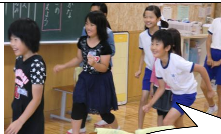
だるまさんがころんだ！