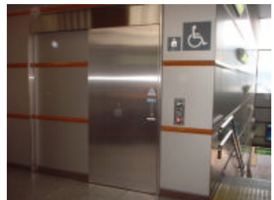
これはいろいろなバリアフリー