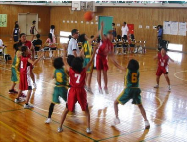
【全力で戦った6年生】