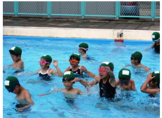
【たくさん泳ぐ練習をしました】

梅雨の天候の合間をぬって水泳学習を行ってきました。1年生は、初めてなので毎回楽しみにして練習を行い、少しずつ水にも慣れ、楽しそうに水の中で体を動かしていました。いよいよ夏休みです。海や川に出かけることもあるかと思えます。プールの水とは違い、海や川は「生きた水」になります。油断していると思わぬ事故になります。決して子どもだけ、一人だけで水の中に入ることがないように、事故にあわないようお願いします。