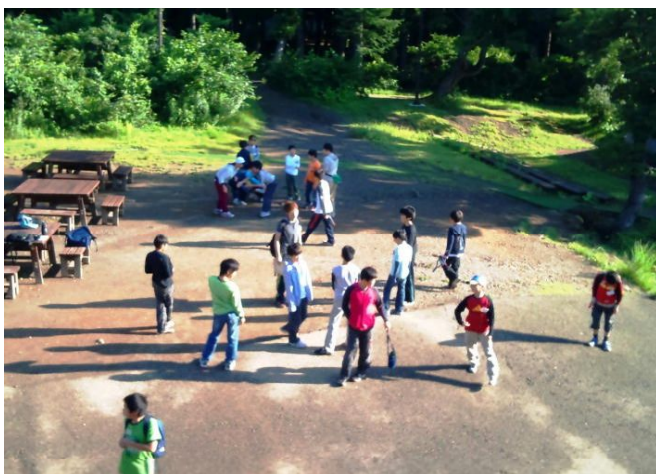
【2日目の朝、うーん眠いなー】