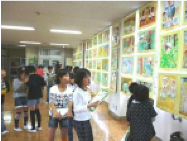
【友達の作品を見て、いいね！】

10月22日（土）、「えがお いっぱい さかせよう」のスローガンのもと、文化祭が行われました。午前の学習発表会では、元気な1年生の「はじめの言葉」の後、学年発表が行われました。地域・保護者の皆様、御協力ありがとうございました。