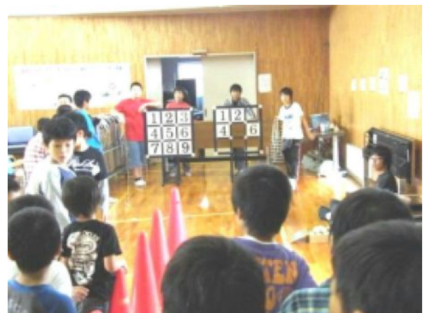
【いろいろなブースがあった体験活動】