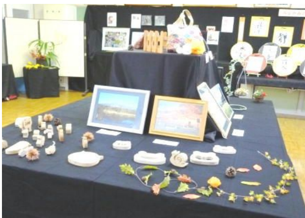
【PTA一般の方の作品展、力作ぞろいでした】