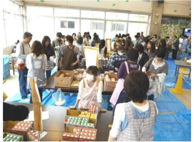
【バザーもにぎわいました】