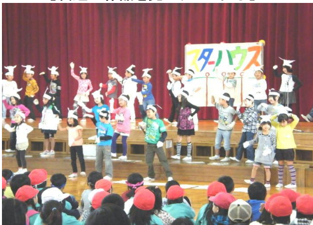
【1年生 ステージデビュー】