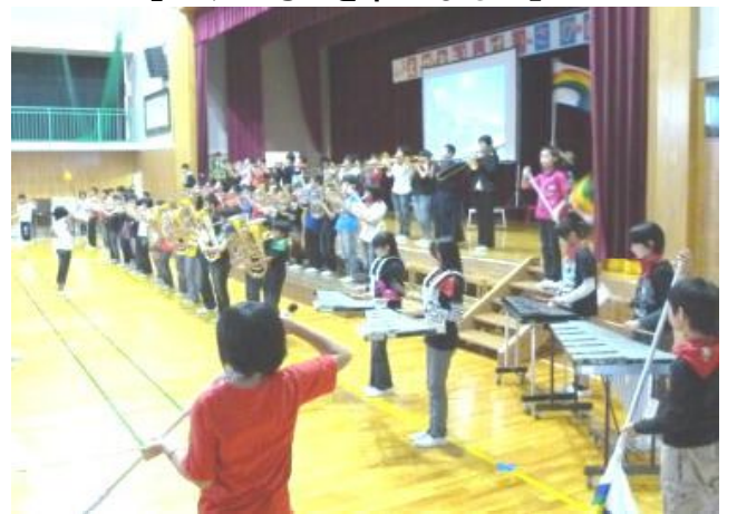
【6年生 迫力満点 ルパン三世の演奏】