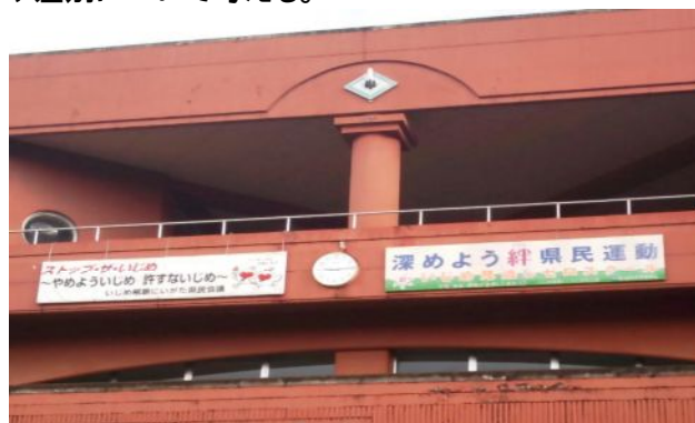
【深めよう絆県民運動の横幕を取り付けました】