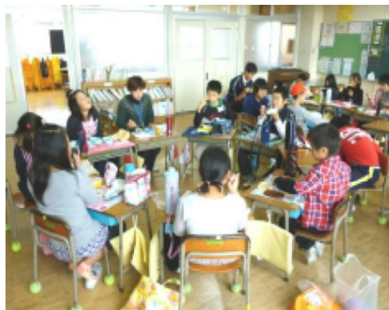
【縦割り班ごとに食べました】