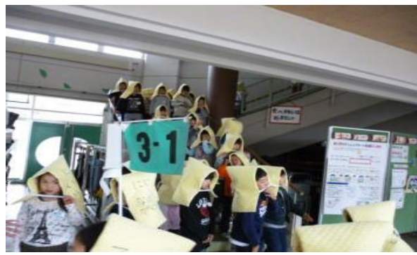
【安全に体育館へ避難】