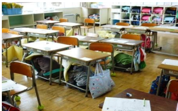
【放送の合図ですばやく机の下へ】

日頃から落ち着いた行動をするとともに、適切な判断力をもって危険を回避する力を育成したいと思います。学校では、様々な場面で指導しておりますが、御家庭におかれましても機会をとらえて具体的な事例を交えながら、きめ細かな指導を合わせてお願いいたします。