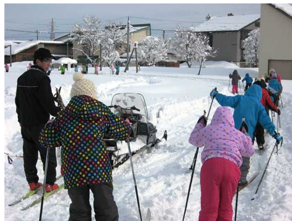
【2年生 高澤前校長先生に教えてもらいました】