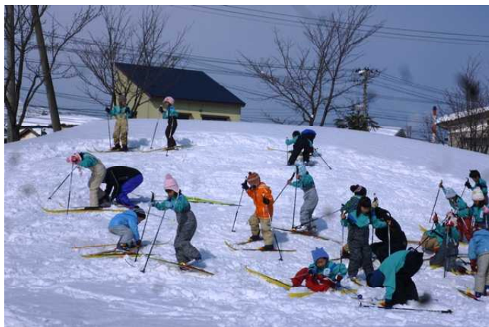
【1年生 やっぱ雪の上は思うようにいきません】

今年は、昨年のような大雪になることもなく予定通り全学年でスキー学習を行うことができました。低学年は、グラウンドで行いました。最初は、おそろおそろ滑っていましたが、慣れてくると自分の力に合わせて滑ることができました。毎年、継続してスキー学習を行うことで、力が伸びることを改めて確認しました。スキー学習にボランティアとして御協力いただきました保護者の皆様、ありがとうございました。