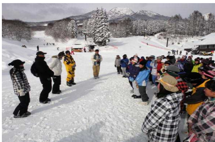
【6年生 最後のスキー教室、たくさん滑りました】