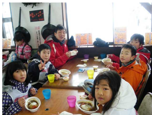
【4年生 お昼はカレー、おいしかったよ】