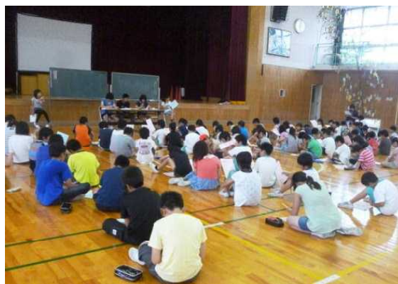
【地域子ども会での話し合いの様子】

また、自転車乗りにつきましては、春からお願いしているヘルメットの着用についてよろしくお願いいたします。私たち大人も子どもの手本になるよう心掛けたいと思います。