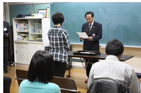
教育長から委嘱状が一人一人の委員に手渡されました

そのために、「新井中央小学校区コミュニティ・スクール運営協議会」では定例の会議を行うだけでなく、3つの部(交流の輪、地域活動の輪、学びの輪)をつくり、保護者や地域の皆様が、実際の教育活動への参画、支援、提言を行う中核として機能していきます。どうぞよろしくお願いいたします。