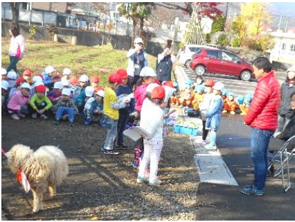
1年 「なか・よし」卒業式