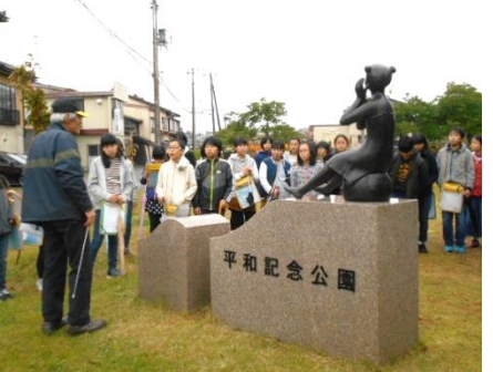
6年 戦争関連施設見学