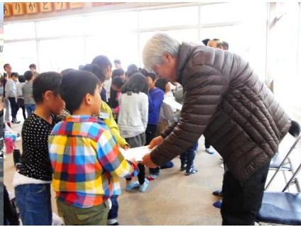
2年 野菜パーティー