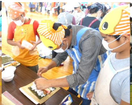
5年 太巻き・サツマイモ汁づくり