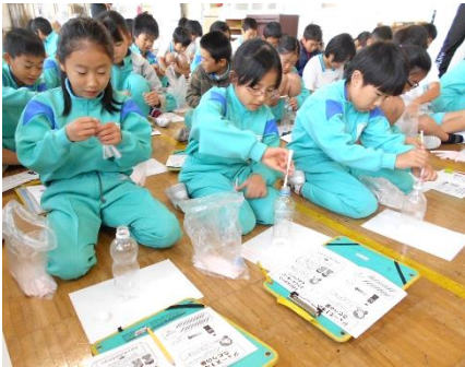
4年 食育～おやつ指導