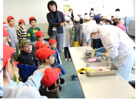
3年 魚住かまぼこ見学