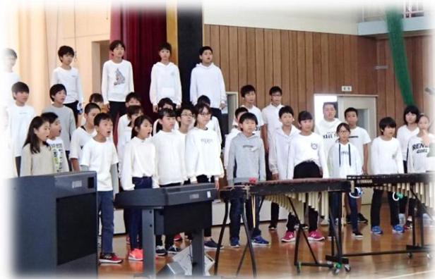
【5・6年生】合奏「宿命」 合唱「空は今」