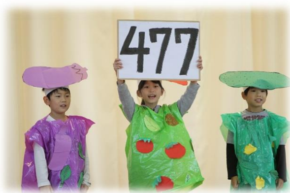
【2年生】レッツ チャレンジファーム！