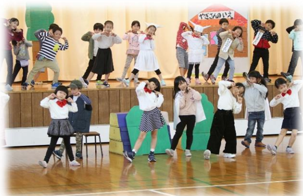
【1年生】やぎさんと キラキラっ子の あついなつ

子どもたちは、この日のために、発表練習や作品作りがんばって取り組んできました。保護者の皆様には、お子さんの学年の発表のみの参観となりましたが、笑顔で一生懸命発表する子どもたちの輝く姿をご覧いただけたと思います。ご来場いただき、ありがとうございました。