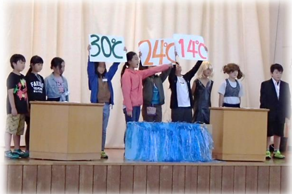
【4年生】クイズ！あなたは小学4年生より賢いの？～自然編～