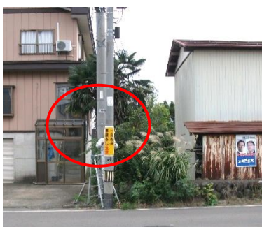
左写真：上百々1丁目付近 「児童多し スピード落とせ！」