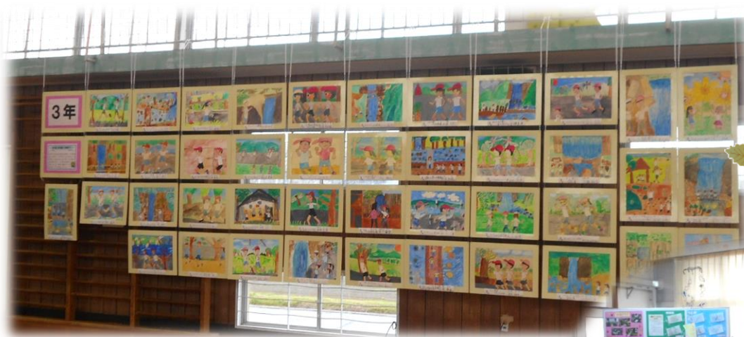
【絵画作品】子どもたち一人一人の絵画作品を体育館に展示