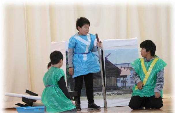
【3年生】GoToキャンペーン北小一家はどこへ行く？