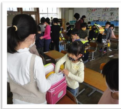
5年生：朝の支度の手伝い