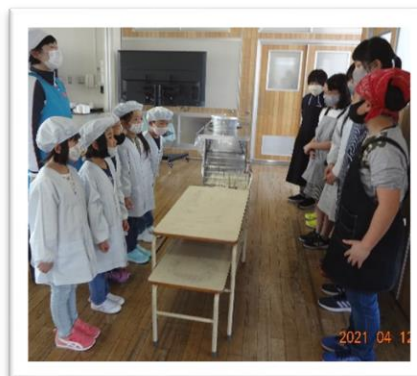
6年生：給食の手伝い