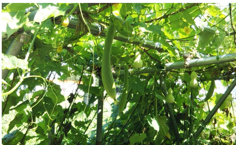
4年生 ヘチマとひょうたんが実っています

この災害が、いつ自分の近くで起こるか分からないのが今の日本です。災害を防ぐには、「自分の命は自分で守る」が基本。そして「自助、共助、公助」による助け合いが大事ですね。家族の絆、地域の絆を深く感じるときでもあります。避難のときも、感染防止も子どもだけではまだまだ難しいです。大人の力、家族の力、地域の力をお貸しください。学校も情報を共有しながら、子どもたちへの指導、支援に努めてまいります。