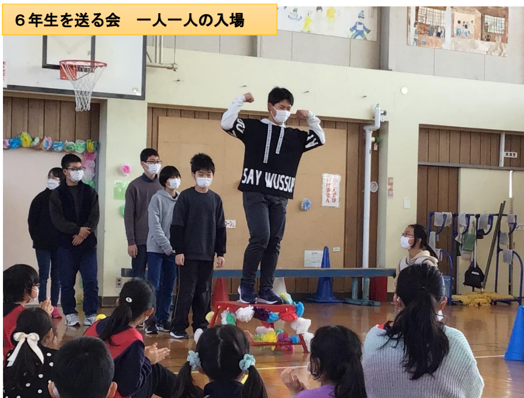
6年生を送る会 一人一人の入場

今年度は、ここまで新型コロナウイルスさらにインフルエンザ感染症による学級閉鎖など、目に見えないウイルスと対峙しながら、様々な活動を進めてきました。幸いにも行事や活動すべて制限しながらも実施することができたことが何よりです。