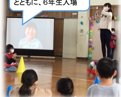
1年生の頃の顔写真とともに、6年生入場

久しぶりに全校が顔を合わせ(残念ながら4年生は学級閉鎖のためリモートで参加)、思い出に残る温かい会となりました。