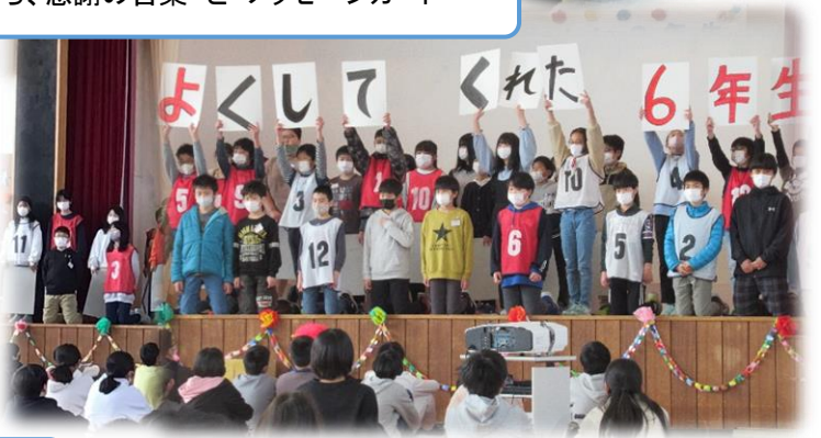
6年生から、在校生へのメッセージ