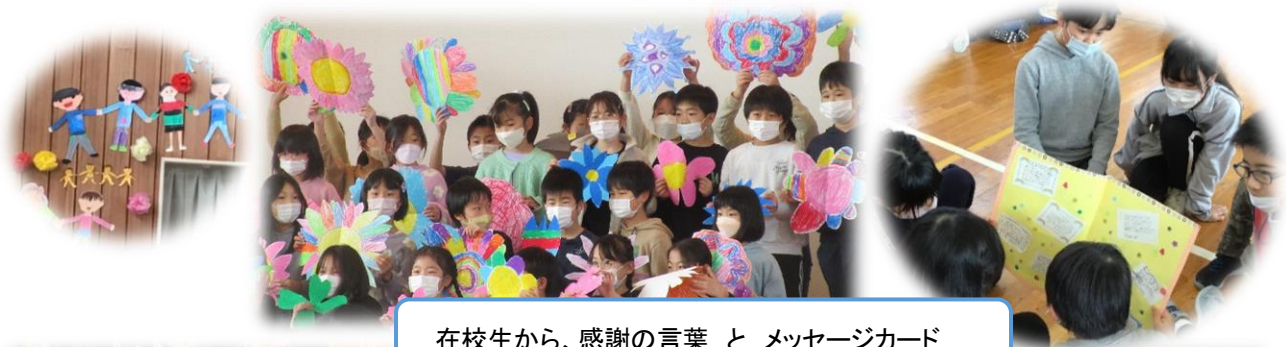
在校生から、感謝の言葉 と メッセージカード