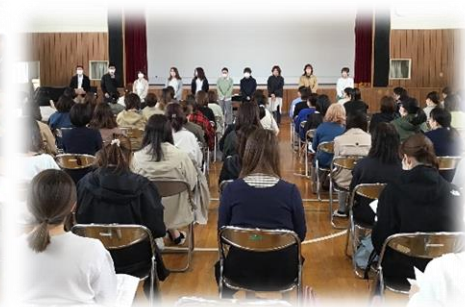
学校説明会・PTA 総会