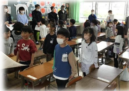
1年生：初めての学習参観

学校説明会・PTA 総会は、3年ぶりに体育館で行いました。学校の教育活動の方針や PTA 活動について共通理解いただきました。たくさんの保護者の皆様からご参加いただき、ありがとうございました。