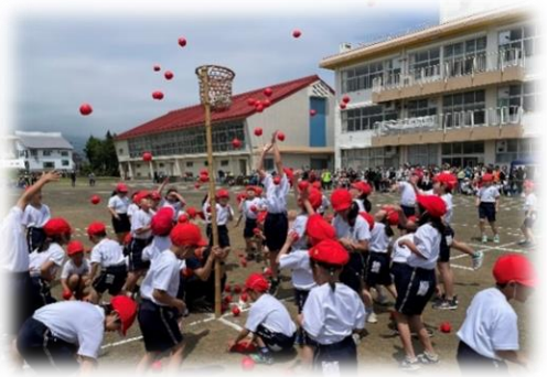
下学年団体種目 チェッコリ玉入れ