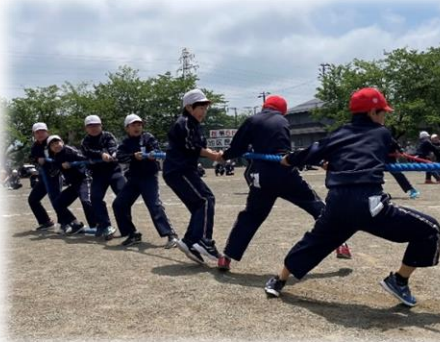
上学年団体種目 5色綱引き