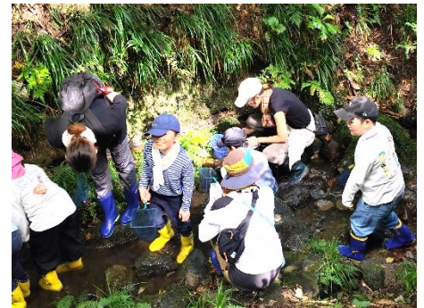
9月11日(水) 3年PTC 自然の家で源流探検