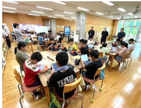
9月4日(水) 人権教育、同和教育授業公開