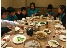
鼎泰豊 小籠包で有名なお店