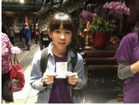
台北 龍山寺 おみくじを引きました。