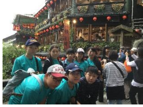
九份 映画「千と千尋の神隠し」