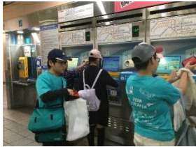
台北駅 地下鉄乗車券購入