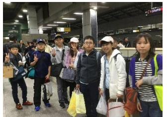
東京駅 お土産がたくさん

11月27日（火）、市役所に行き、6年生一人一人が宿泊体験学習で感じたことなどを市長に報告しました。初めての乗り物のこと、それぞれの見学地のこと、交流先の小学校でのこと、食べ物のこと、それぞれの思いを伝え、市長の質問にも答えました。市長から、「この体験を自信とし、広い視野をもって、これからの生き方を考えていってほしい。この感動と、支えてくれたすべての人への感謝の気持ちを大切に」とお話をいただきました。