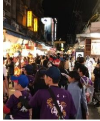
士林夜市「迷子になるなよ」