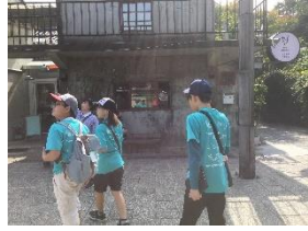
台北 101 周辺 班別行動