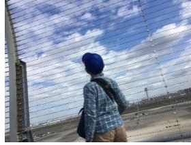
「本当に 空を飛ぶの…」