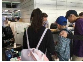
羽田空港 搭乗手続き