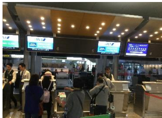
台北松山空港 寂しいような、家が恋しいような