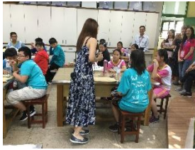
北投区文化国民小学校 台北の子どもたちと交流