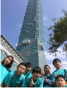
台北 101 と 6 年生