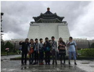
中正紀念堂 蒋介石氏の資料や衛兵交代式