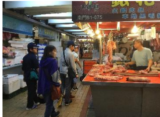
朝市 野菜や肉、魚などがたくさん