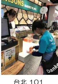
台北 101 一人でお買い物