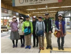
上越妙高駅 いよいよ出発です。