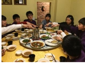
台湾料理店で夕食 「これが一番おいしかった」