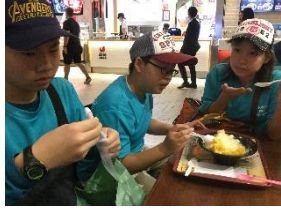
台北 101 のフードコート 憧れのマンゴーのかき氷