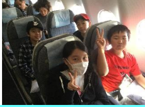
羽田空港からの飛行機