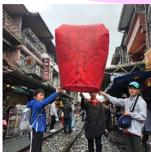
十分（ランタン上げ）

交流校の友達が、真剣に笑顔で聞いてくれたのでよかったです。交流校の友達の質問には、自分も笑顔で返せました。ぜひ、妙高市に来てほしいです。