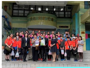
交流校で。妙高市のアピール