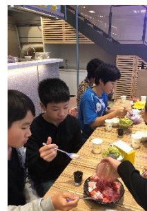
アイスモンスター