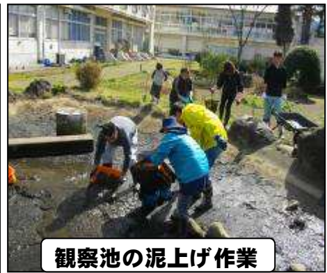
観察池の泥上げ作業