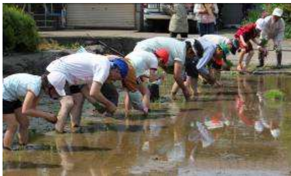
～じよんのび会の皆さん・保護者の皆さんと田植え～

がいいってことなんだよ」「姫川原は水がいいんだよ」「手間暇かけ、低農薬で育てているんだ」「だから姫川原のお米は美味しんだよ」と自慢げに話しています。