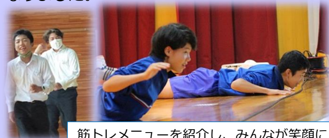
筋トレメニューを紹介し、みんなが笑顔に！