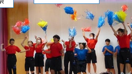
1年生全員によるパフォーマンス