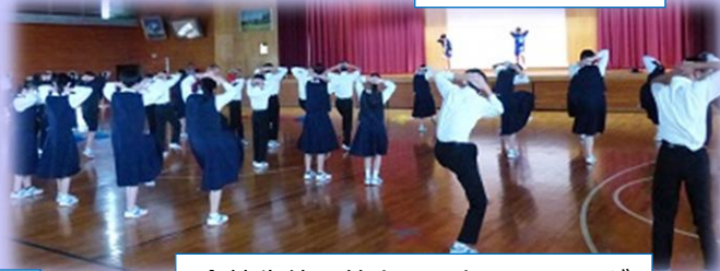
全校生徒で筋力upトレーニング