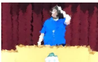
子どもたちへのメッセージ

ユーモアたっぷりだった先生。子どもたちは大好きでした。先生から外国の言葉や文化を学んだ経験は、子どもたちにとってかけがえのない経験となりました。