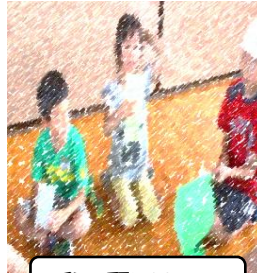
私の願いは・・・