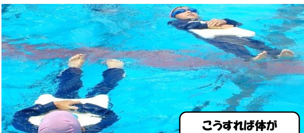
こうすれば体が自然と浮くんだね

水泳学習の終盤、どの学年も水の事故を防ぐ一環として、服を着たまま泳ぐ「着衣水泳」に挑戦しました。見るのと実際にやってみるのでは大違い。子どもたちは、水の中で服が重くなる感覚や肌にまとわりつく感覚、また、水着で泳ぐよりもずっと泳ぎにくくなる感覚を体験しました。