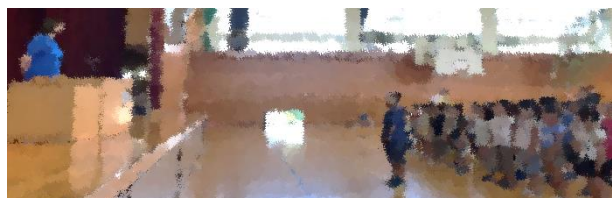
先生へ児童からお礼の言葉