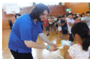
子どもから手紙のプレゼント