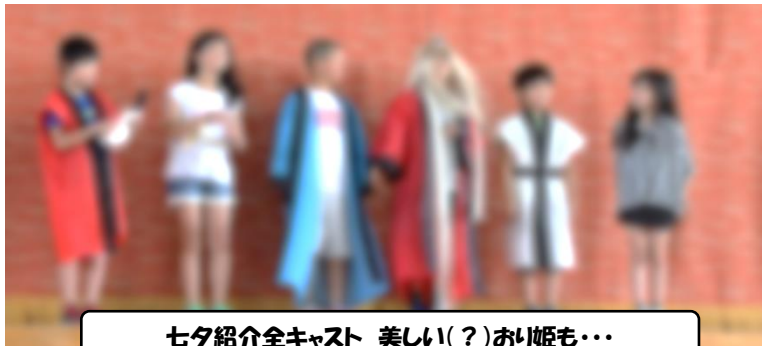
七夕紹介全キャスト 美しい(?)おり姫も・・・