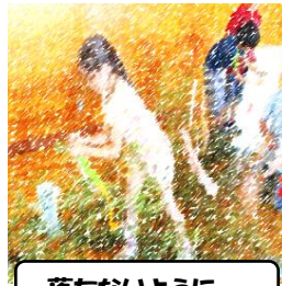
落ちないように・・・