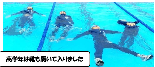
高学年は靴も履いて入りました