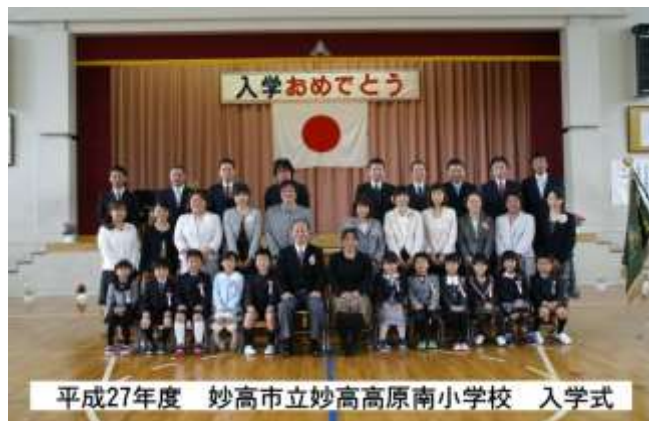
平成27年度 妙高市立妙高高原南小学校 入学式