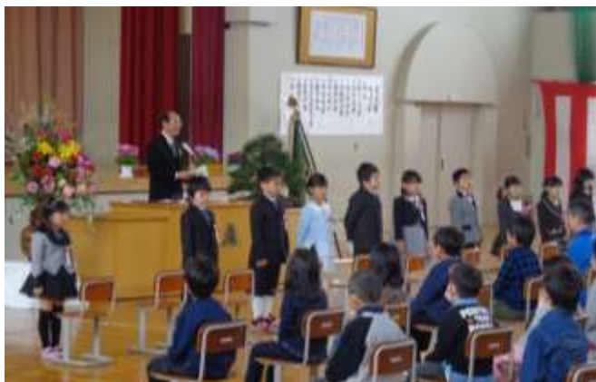
2～6年生に元気よく、「よろしくお願ひします」のあいさつ

新1年生を迎え、今年度の妙高高原南小学校は全校児童79名です。一人一人の子どもた