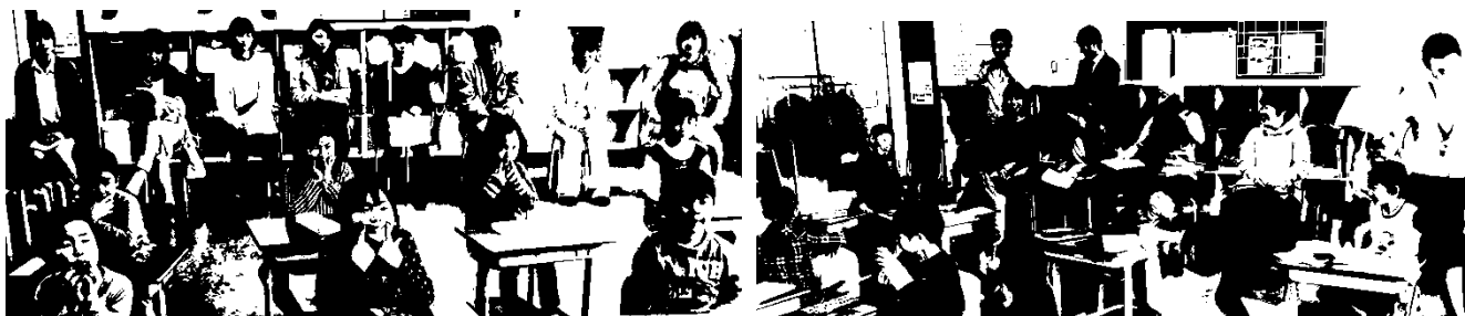
1年生 国語「あいうえお」

先日のPTA総会等には、たくさんの保護者の皆様からお越しいただきました。9割ほどのご家庭の出席率に驚くとともに、教職員を代表して深く感謝申し上げます。授業参観にお越しいただいた皆様の姿を見て、子どもたちは大変喜んでいました。私も子どもたちの喜ぶ姿を見てうれしくなりました。そして『子どもたちや保護者の期待に応えられるようがんばろう』という気持ちがわき上がってきました。