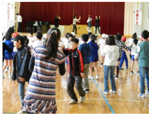
「杉野沢小唄」のおどり練習