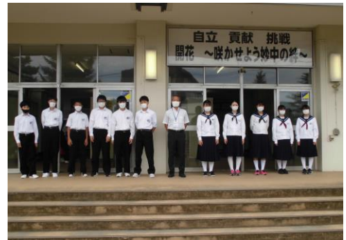
挨拶運動の参加者と 生徒会スローガン

（The best way to cheer yourself up is to try to cheer somebody else up.）」を実感した場面でした。