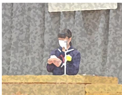
【新入生代表誓いのことば】