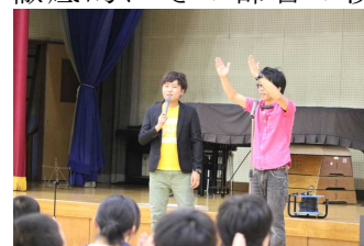
お笑い集団NAMARAのジャックポットのお二人

このように、他者の答を聞くうちに、図らずも闇雲に漢字を探すのではなく、あるやり方に則して漢字を探していることに気付きました。私のように想像(創造)力に乏しい人間にとっては、まず図形に含まれる部首を見付け出し、徹底的にその部首の漢字を見つけ出していくやり方が合っているようです。実はこの作業にすっかりはまってしまい、失礼ながらその後のお笑い漫談もそっちのけで考え続けていました。さらに家に帰っても気になって仕方がないので、漢和辞典で調べてみました。一画面から聞いたこともない部首や見たこともない漢字がどんどん出てきました。例えば、「たてぼう」という部首があり「个」という漢字がありました。「母屋のわきにある小さい部屋」という意味で人やものなどを数えるときに使うとのこと。ジャックポットのお二人によれば、四十数個は見つかるとのことでしたが一画、二画、三画の部首だけで軽く50を越えてしまいました。