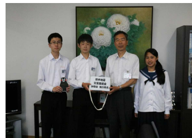
熊本震災災害義援金 募金総額1万6300円を復興に 役立ていただくこと妙高市教育委員会に贈呈しました。