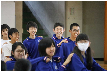
生徒朝会の保健委員会企画の じゃんけん列車 みんなが一つになった時間を過ごしました