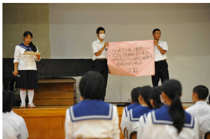
第1回フレンドリースクール集会 「一日一善運動」プロジェクトや委員会、部活動それぞれで出来ることを考えました。