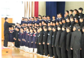
妙高音楽祭 (全校合唱)