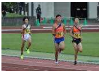
上越地区駅伝大会