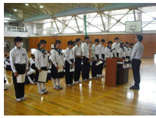
全校朝会 (各種大会表彰)