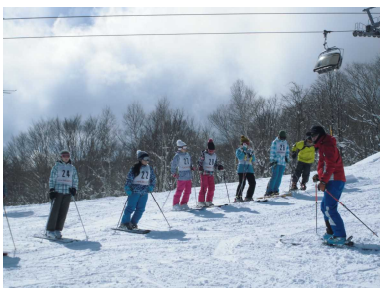
インストラクターから指導を受ける1,2年生スキー教室