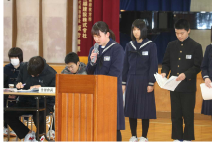
活発に意見交換できた生徒総会