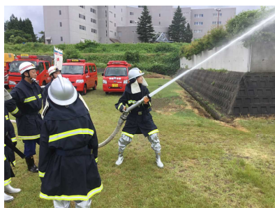
第1回避難訓練（6月12日）

ボイラー室で火災発生、避難。消防署や多くの消防団の方々から御協力をいただきました。