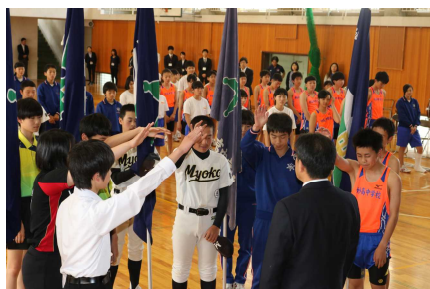
部活動結団式（5月24日）