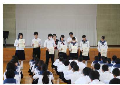
上越合同各種大会報告会（6月19日）

ボイラー室で火災発生、避難。消防署や多くの消防団の方々から御協力をいただきました。