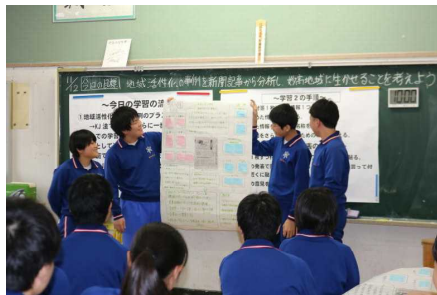
【NIE（新聞活用教育）授業の様子】