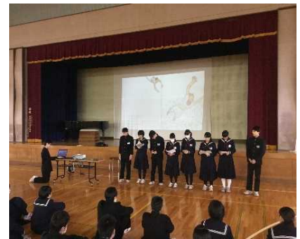
図書委員による読み聞かせ

1年生の国語の授業では、図書室にある本を用いてさまざまな故事成語を調べ、その中の一つを選んで成り立ちや使い方を発表する活動を行いました。2年生では漢詩の学習、3年生では論語の学習で、図書室を効果的に使っています。また、生徒会図書委員会では、毎年全校生徒に読み聞かせを行っています。