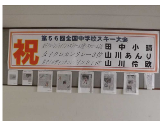
大活躍の全中スキー大会