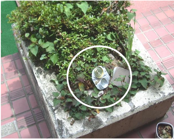
植え込みの中に密かに隠された「宝もの」の空き缶。 ご来校の際は、ぜひご覧ください。

これは何だろう？ 4月に児童玄関の植え込みに空き缶があるのを発見しました。「こんなところに空き缶を捨てるなんて」と、その空き缶を捨てようとしたところ、これが子どもたちの大切なものであることを教えてもらいました。缶けりをするための「空き缶」なのです。